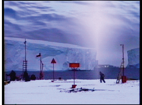
Voyage d'hiver_ Winter landscapes, 1993